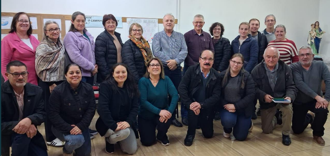
Participantes da reunião