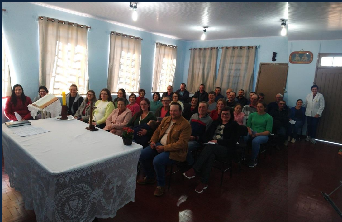
Comunidade São Jorge de Cerro Alegre

Na visita às comunidades no mês de maio, antes da celebração de Pentecostes, a missa se realiza dentro da perspectiva da vinda do Espírito Santo sobre os apóstolos e sobre a Igreja. Destaca-se a presença de Maria, a Mãe de Jesus, junto com os apóstolos em Jerusalém, também a presença hoje das mães junto à sua família e na comunidade, elas que foram lembradas no segundo domingo de maio.