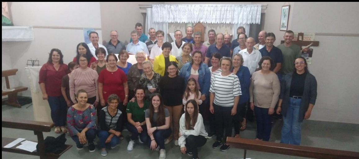
Comunidade Santo Antônio

O evangelho proclamado na missa narra o encontro de Cristo ressuscitado com os apóstolos reunidos no primeiro dia da semana sem a presença de Tomé. Oito dias depois, de novo o encontro, desta vez com a presença de Tomé. Os apóstolos logo reconheceram o primeiro dia da semana como o dia do Senhor, dando origem ao Domingo.