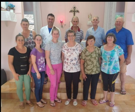
Comunidade São Miguel