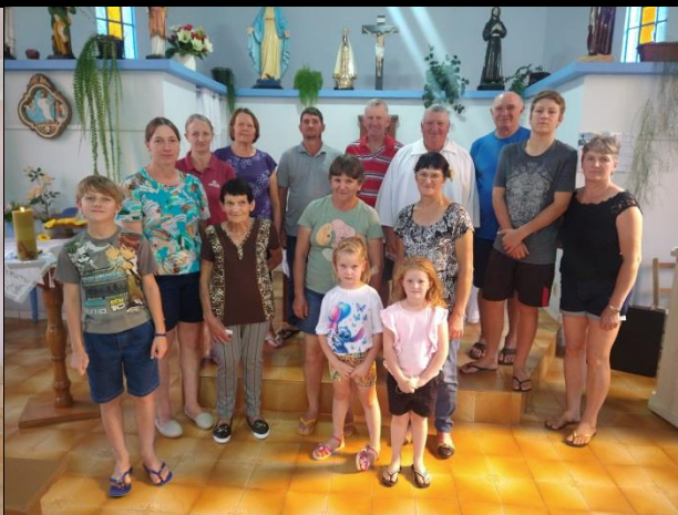
Comunidade Santo Antônio – Lajeado Leão