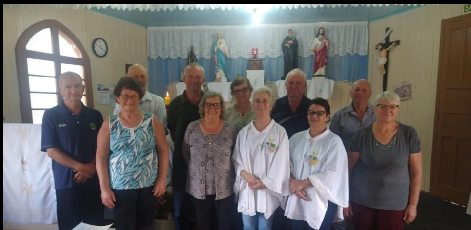
Comunidade Santo Estanislau

O evangelho proclamado na missa narra o encontro de Cristo ressuscitado com os apóstolos reunidos no primeiro dia da semana sem a presença de Tomé. Oito dias depois, de novo o encontro, desta vez com a presença de Tomé. Os apóstolos logo reconheceram o primeiro dia da semana como o dia do Senhor, dando origem ao Domingo.