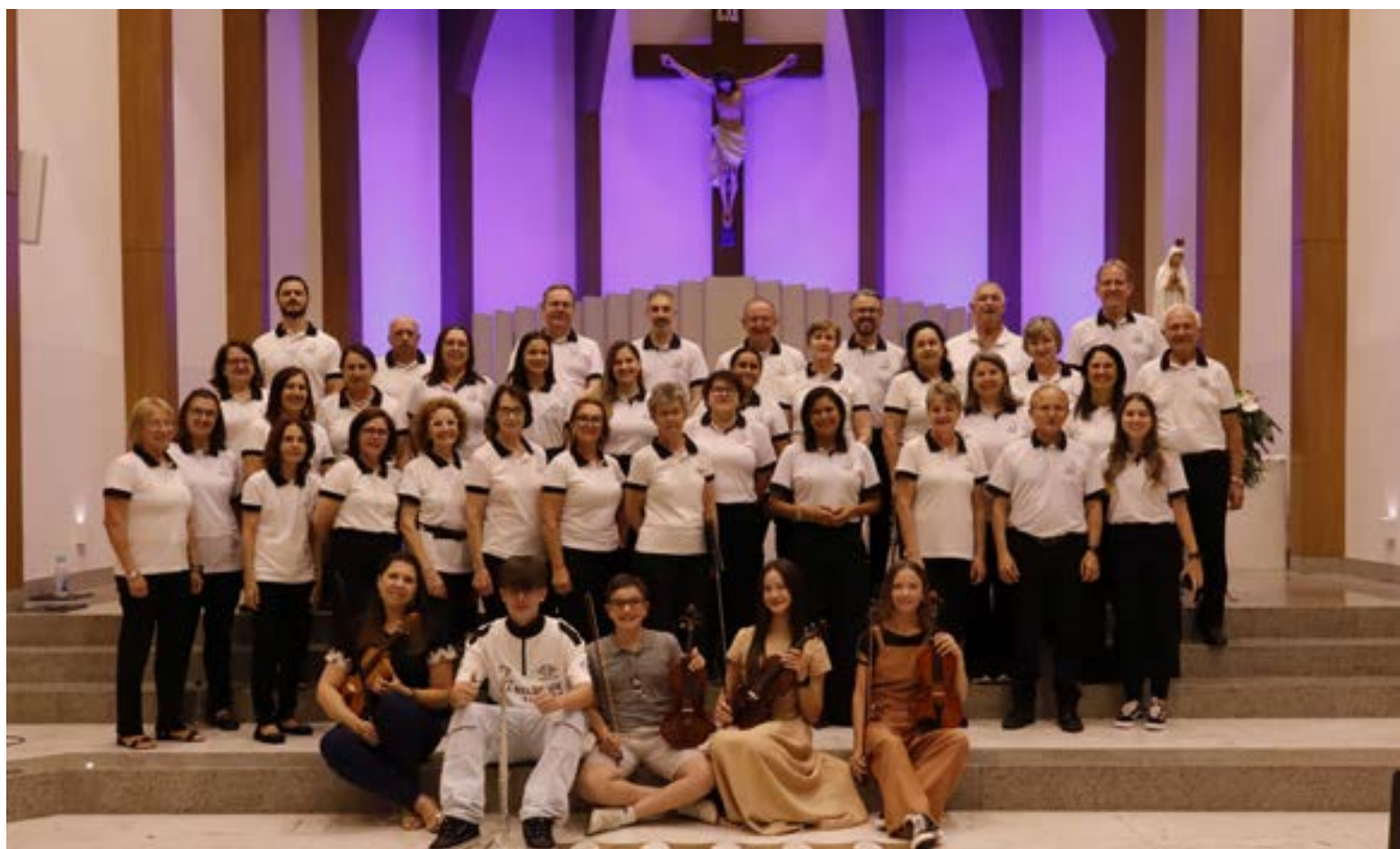
Grupo reúne coralistas e instrumentistas que se apresentam nos eventos da Diocese e no primeiro domingo de cada mês no Santuário

Fundado em 2003, grupo reúne mais de 40 coralistas e participa das principais celebrações litúrgicas da Diocese