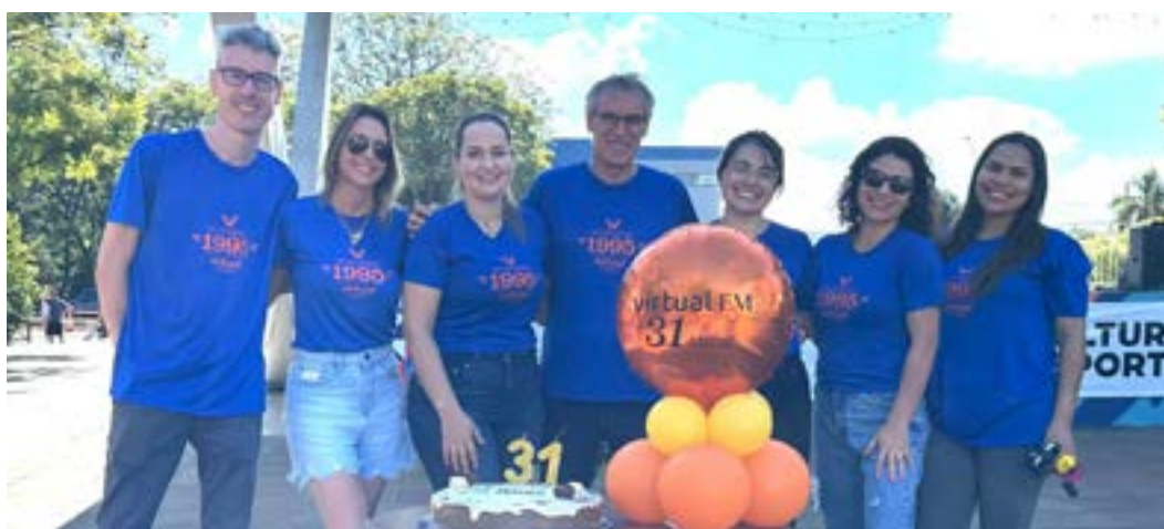
Equipe da Rádio Virtual celebrou seus 31 anos junto ao evento Movimenta Erechim

Essa trajetória foi celebrada com uma programação especial no dia 19 de março, Dia de São José, padroeiro de Erechim e que tem seu nome gravado na história da emissora. Neste dia a equipe esteve presente no Movimenta Erechim, evento organizado pela Prefeitura do município com a participação de diferentes entidades. Com sua Unidade Móvel, a rádio participou com atividades de divulgação e interação com o público, ação que buscou não apenas fortalecer sua marca, mas também ampliar o diálogo com a comunidade.