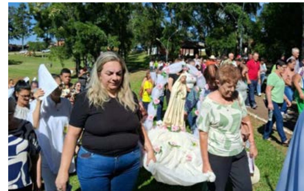
Romaria das Águas é considerada um dos eventos religiosos tradicionais da região

lembrando que a água representa vida, purificação e renovação. Segundo ele, o momento também convida à conscientização sobre a importância da preservação dos recursos naturais e da responsabilidade coletiva no cuidado com a criação.