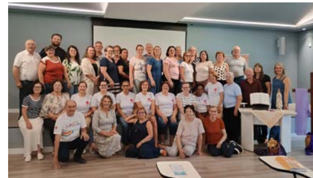
A atividade reuniu representantes de diversas comunidades

Na segunda parte do encontro, o coordenador diocesano da Cáritas,