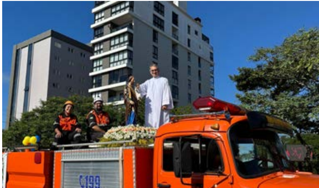
Carreata com a imagem de São José percorreu ruas da cidade no dia do padroeiro

A programação foi concluída no dia 19 de março com a tradicional carreata, que saiu do