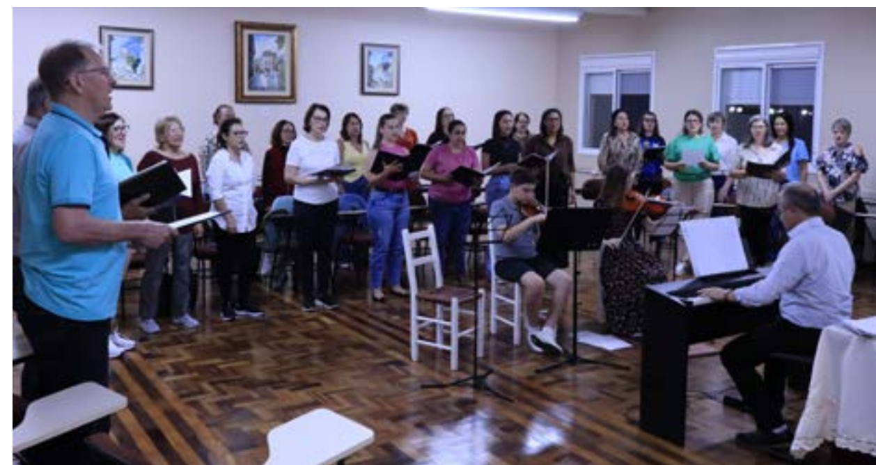
Ensaios semanais são realizados nas quintas-feiras à noite no Seminário de Fátima

presente, a música ajuda a conduzir a oração e a aprofundar a experiência da fé. Como resume o próprio padre Sala, quando o coro canta e as pessoas rezam em unidade, a liturgia ganha ainda mais intensidade, ou seja, um momento em que, mesmo com os pés no chão, a comunidade é convidada a experimentar um pouco do céu.