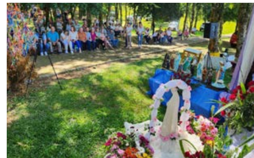
Caravanas de diversos municípios da região participam da Romaria

O padre também relacionou a reflexão com o sentido da Romaria das Águas,