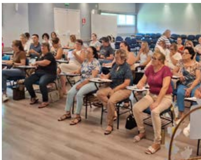
Encontro formativo foi o primeiro de 2026

O setor de Animação Bíblico-Catequética da Diocese promoveu, no dia 16 de março, o primeiro encontro formativo de 2026 com as coordenadoras paroquiais da Catequese. A abertura contou com uma reflexão sobre a Campanha da