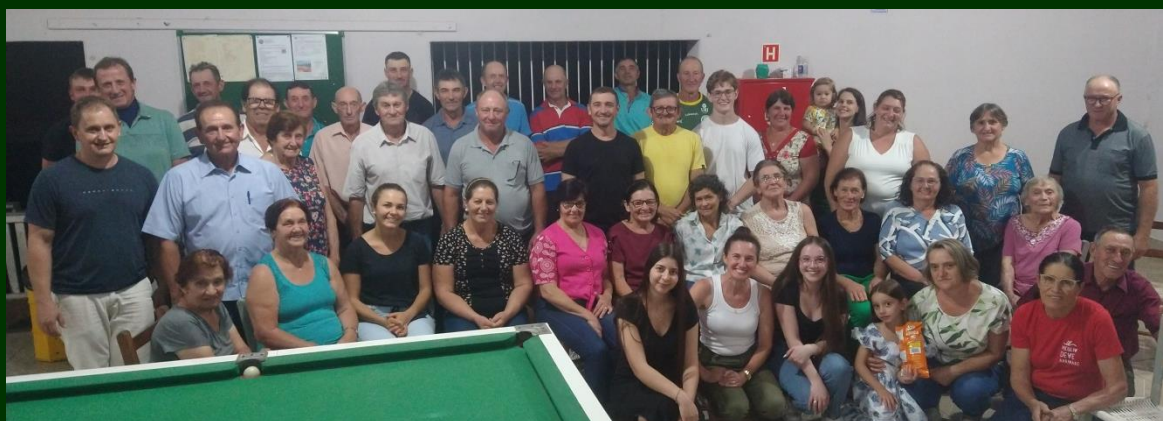
Comunidade Santo Antônio, depois da missa, confraternização no salão

No mesmo dia, às 19h30, foi a vez da comunidade Santo Antônio a receber a visita do pároco. Esta comunidade é formada por 34 famílias.