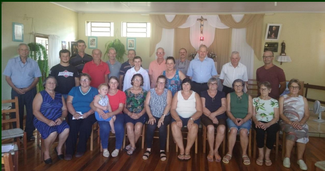
Comunidade São José de Anchieta