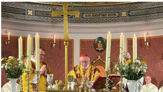
O cardeal Paroliin na Catedral de Copenhage

Ao deixar lugares e pessoas familiares para seguir Jesus, Ansgário nunca vacilou, demonstrando “coragem e confiança” que impressionaram seus contemporâneos: o discípulo e biógrafo de Ansgário, São Remberto, anotou na “Vita Anskarii” a admiração daqueles que o viam fazer escolhas dolorosas por amor a Cristo. Em sua obra, o beneditino dava prova do cristianismo vivendo como cristão, em linha com o Evangelho que, como observou o secretário de Estado, não oferece “soluções abstratas”, mas uma “visão da pessoa humana cuja dignidade precede qualquer cálculo”.