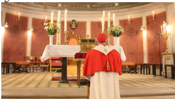
Um registro da visita do cardeal Parolin na Dinamarca, realizada de 24 a 26 de janeiro

Parolin convidou, nas celebrações jubilares dedicadas ao santo, a “renovar a ousadia evangélica” e a “guardar a esperança onde a história parece cansada” para testemunhar que a fecundidade “nasce do amor que une e da confiança na ação contínua de Deus, mesmo nas situações mais frágeis”.