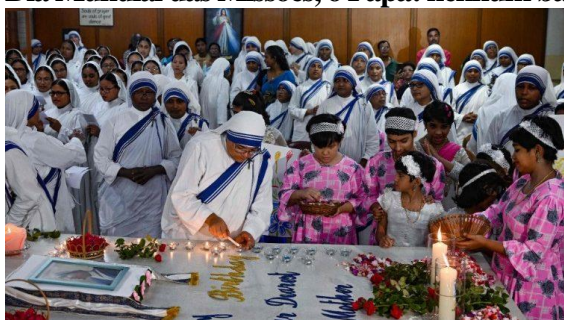
Irmãs missionárias na Índia

Em sua mensagem para o 100º Dia Mundial das Missões, Leão XIV recorda o contexto atual marcado por "polarizações", "conflitos" e "desconfiança mútua", exortando a uma unidade que não deve ser entendida como "uniformidade", mas como uma convergência na qual diferentes culturas se expressam "na mesma fé"