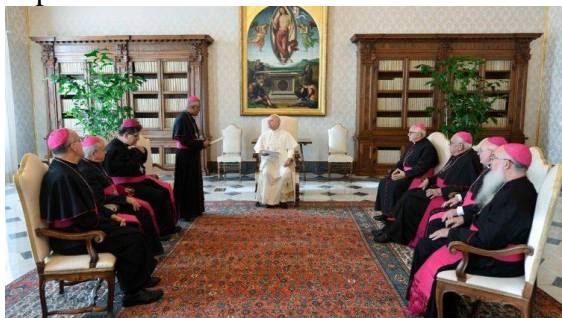
O Papa Leão XIV recebe os bispos de Porto Rico em visita 'ad limina'

"Um momento especial, bem como uma experiência de alegria, grande fé e muita esperança". Com essas palavras, dom Eusebio Ramos Morales, bispo de Caguas e presidente da Conferência Episcopal de Porto Rico, descreveu a 'visita ad limina' de sexta-feira, 23 de janeiro, a Leão XIV, no Palácio Apostólico vaticano.