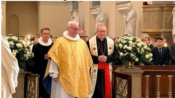
Na catedral luterana de Copenhague

como membros do mesmo Corpo de Cristo, apesar das diferenças históricas e litúrgicas”. Lembramos que a Igreja no Brasil celebra a "Semana de Oração pela Unidade dos Cristãos" entre o Domingo de Pentecostes e o Domingo da Ascensão, este ano, entre os dias 17 e 24 de maio.