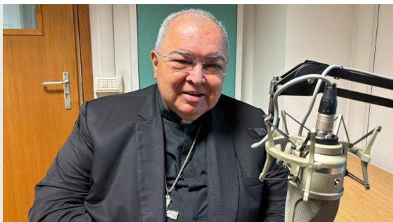
Cardeal Orani João Tempesta

O Papa explicou que a reunião destes dois dias se coloca “em continuidade” com o que foi pedido às congregações gerais antes do Conclave e manifestou a vontade de continuar os Consistórios com periodicidade anual e duração de 3 a 4 dias.