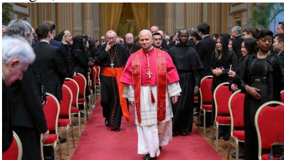
Audiência ao Corpo Diplomático é uma tradição no início do novo ano

No panorama mundial, o Pontífice falou das crises em Mianmar e na região africana dos Grandes Lagos, no Sudão e Sudão do Sul.