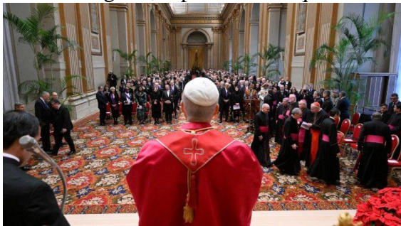
Papa se reúne pela primeira vez com o Corpo Diplomático

Moçambique. Já na Europa ou nas Américas, verifica-se uma forma sutil de discriminação por razões políticas ou ideológicas, especialmente quando se defende a dignidade dos mais frágeis.