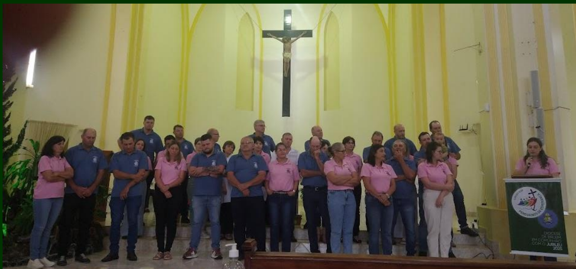
Conselho 2023,2024 e 2025

Domingo passado, 11 de janeiro de 2025, na missa iniciada às 9h, na igreja da sede paroquial de Jacutinga, assumiu o novo conselho econômico 2026. O rito realizou-se no final da missa logo antes da bênção.