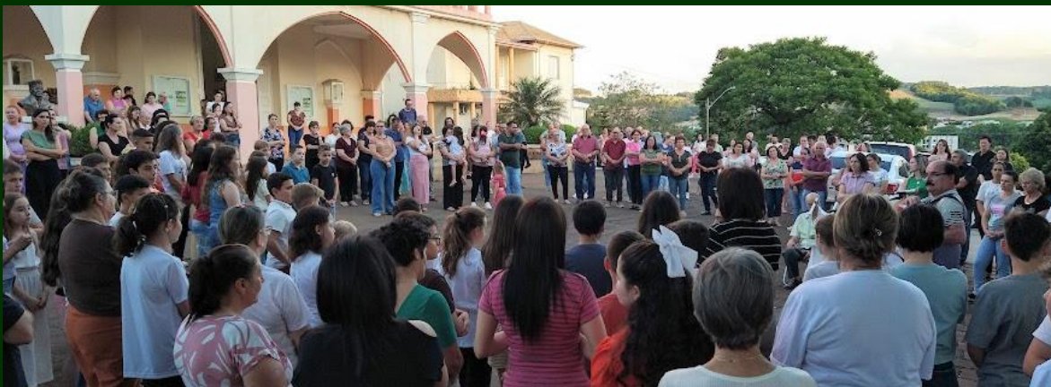
Oração do terço, no 8º dia da Novena

“Glorificado seja Deus Pai, por Cristo, no Espírito! Santificada seja a vida de cada irmão e irmã”. Esta é a finalidade da liturgia.