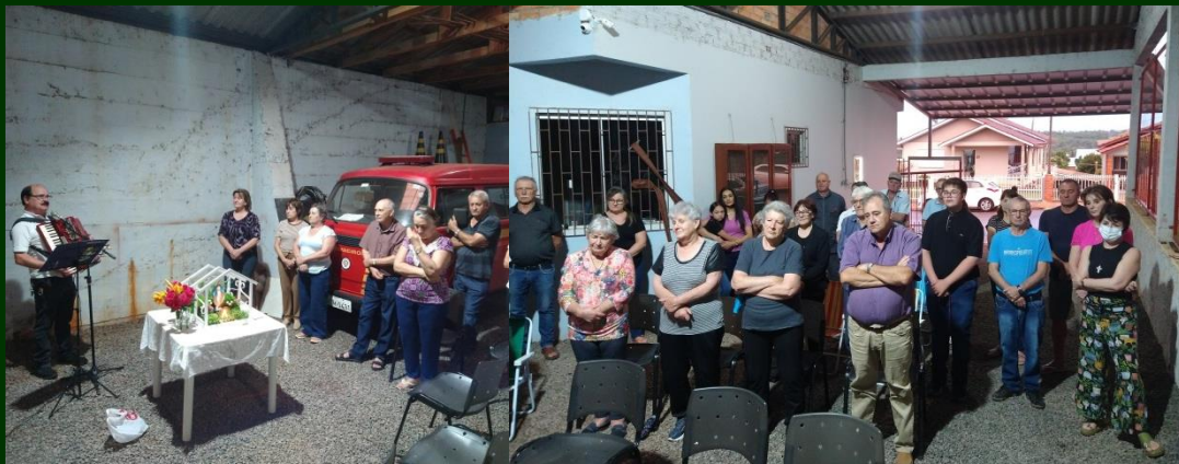
Junto à Sede do Corpo de Bombeiros Voluntários de Jacutinga

Em preparação à Romaria de Nossa Senhora das Graças, a realizar-se neste sábado e domingo, 29 e 30 de novembro, aqui em Jacutinga, o povo está fazendo a novena da oração do terço cada dia em lugar diferente da cidade. Pessoas dos arredores do lugar se reúnem ao redor da imagem de Nossa Senhora das Graças e recitam a oração do terço, contemplando os mistérios indicados para cada dia.