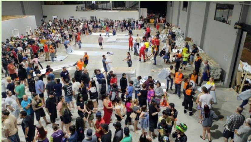
A distribuição de lonas para amenizar os prejuízos

"O que pela fé conseguimos assistir é a capacidade muito grande de viver a solidariedade; de emprestar escada, telha; coisas simples que podem fazer a diferença como subir numa casa para ajudar a consertar ou cortando uma lona para que mais casas sejam protegidas; além da presença de muitos voluntários. As dificuldades e o sofrimento nos humanizam."