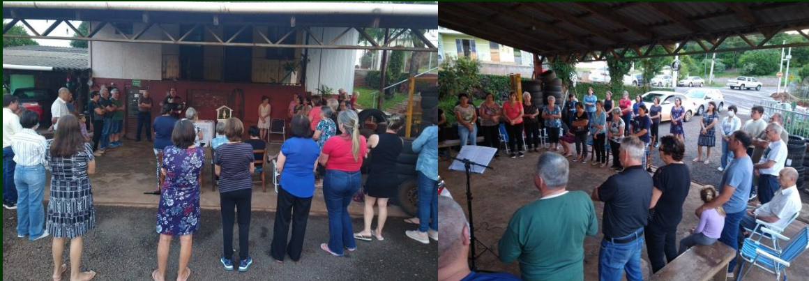
Oração junto à Borracharia do Sommer

Em preparação à Romaria de Nossa Senhora das Graças, a realizar-se neste sábado e domingo, 29 e 30 de novembro, aqui em Jacutinga, o povo está fazendo a novena da oração do terço cada dia em lugar diferente da cidade. Pessoas dos arredores do lugar se reúnem ao redor da imagem de Nossa Senhora das Graças e recitam a oração do terço, contemplando os mistérios indicados para cada dia.