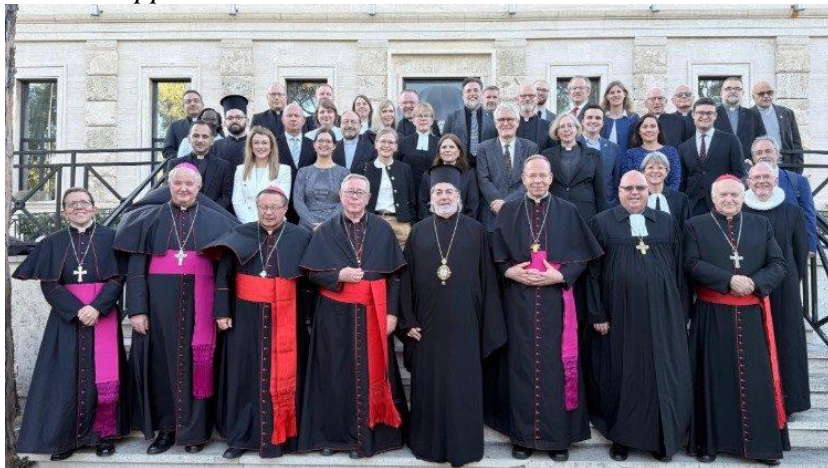
Os signatários da nova Carta Ecumênica

Em meio a guerras, convulsões geopolíticas, mudanças nos equilíbrios globais e o surgimento disruptivo de novas tecnologias, chegou a hora de fazer escolhas corajosas, e os cristãos da Europa a fazem mais uma vez, mas de uma maneira nova, a unidade na diversidade, a unidade na fé em Cristo, o diálogo e o vínculo sagrado da paz.