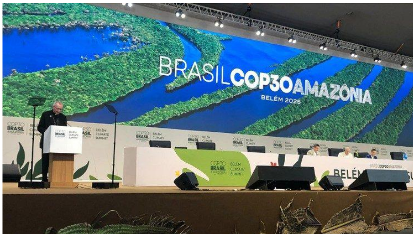
Cardeal Parolin durante a leitura da mensagem do Papa à COP30

“Se vocês querem cultivar a paz, cuidem da Criação. Existe uma clara ligação entre a construção da paz e a custódia da Criação”. Assim se pronunciou o secretário de Estado do Vaticano, cardeal Pietro Parolin, ao ler a mensagem do Papa Leão XIV na 30ª Sessão da Conferência das Partes da Convenção-Quadro das Nações Unidas sobre Mudanças Climáticas (COP30) em Belém, no Brasil. “Se, por um lado, nestes tempos difíceis, a atenção e a preocupação da comunidade internacional parecem concentrar-se principalmente nos conflitos entre as nações”, sublinha o Santo Padre na sua mensagem, “por outro lado, cresce também a consciência de que a paz é ameaçada também pela falta de respeito pela Criação, pela pilhagem dos recursos naturais e pelo progressivo declínio da qualidade de vida devido às alterações climáticas”.