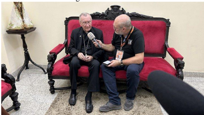
Entrevista cardeal Parolin

“O tempo está se esgotando”. O cardeal Pietro Parolin cita São Paulo para formular seu apelo sobre a urgência de dar “execução” e “concretude” aos compromissos já assumidos nas COPs anteriores sobre as mudanças climáticas. O secretário de Estado está nestes dias em Belém, capital do estado do Pará (Brasil), para liderar a delegação da Santa Sé na “Cúpula do Clima” que antecede a COP30, a 30ª Conferência das Nações Unidas sobre as mudanças climáticas, programada para 10 a 21 de novembro. À mídia vaticana, o cardeal denuncia as proporções cada vez mais alarmantes dessa questão, que hoje causa “mais deslocados” do que os conflitos. Ao mesmo tempo, afirma, a reflexão e a ação sobre as mudanças climáticas podem ser uma oportunidade para relançar o multilateralismo, que há anos vive “uma crise muito grave”.