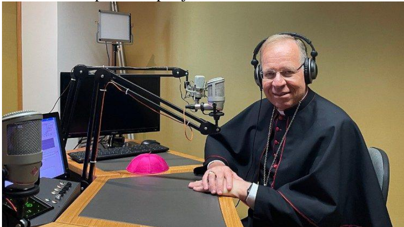
Dom Gintaras Grušas, arcebispo de Vilnius e presidente da CCEE

necessidade de curar as fraturas, porque une não apenas pessoas de diferentes igrejas e denominações, mas também do Leste e do Oeste, do Norte e do Sul, e busca a unidade. E quando falamos de unidade ecumênica, não nos referimos apenas a doutrinas, mas ao trabalho comum, à missão e ao testemunho: este é o caminho para evangelizar a Europa hoje. Na Ucrânia, precisamos dessa perspectiva, dessa diplomacia, e não de armas, para ajudar os políticos a lutarem pela paz, a ajudarem os necessitados, mas acima de tudo, há o poder da oração. Nós também devemos fortalecer nossa oração pela paz, como o Santo Padre sempre enfatiza, e devemos também orar pelo dom da sabedoria para que os políticos encontrem o caminho para uma paz justa."