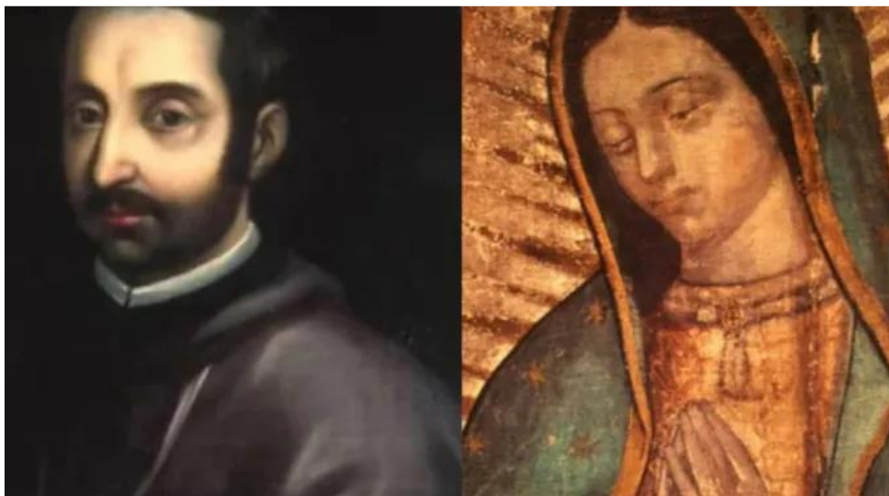
Nossa Senhora de Guadalupe e o beato Juan de Palafox y Mendoza.

Numa mensagem aos participantes do XVII Congresso Nacional Missionário do México, que ocorre em Puebla, México, entre hoje (7) e domingo (9), o papa disse que o maior privilégio e dever dos missionários é "levar Cristo ao coração de cada pessoa".