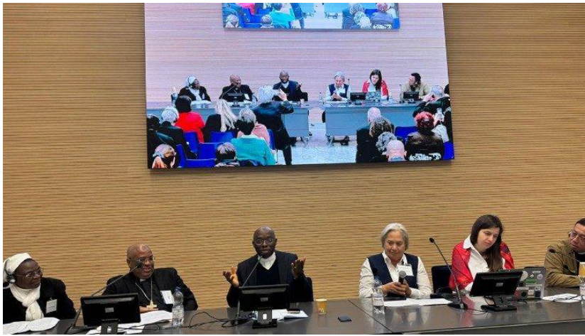
Um momento da conferência “Ministério da Esperança”