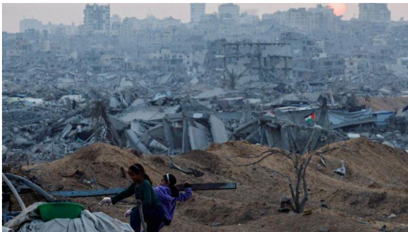
Crianças em meio aos escombros de Gaza

O presidente estadunidense, Donald Trump, falando com os jornalistas, disse que uma força internacional de estabilização será enviada "muito em breve" para Gaza, um dia depois de os Estados Unidos anunciarem um projeto de resolução do Conselho de Segurança da ONU com o objetivo de apoiar o plano de paz do presidente norte-americano. "Muito em breve, muito em breve. E as coisas estão indo bem em Gaza", enfatizou o inquilino da Casa Branca.