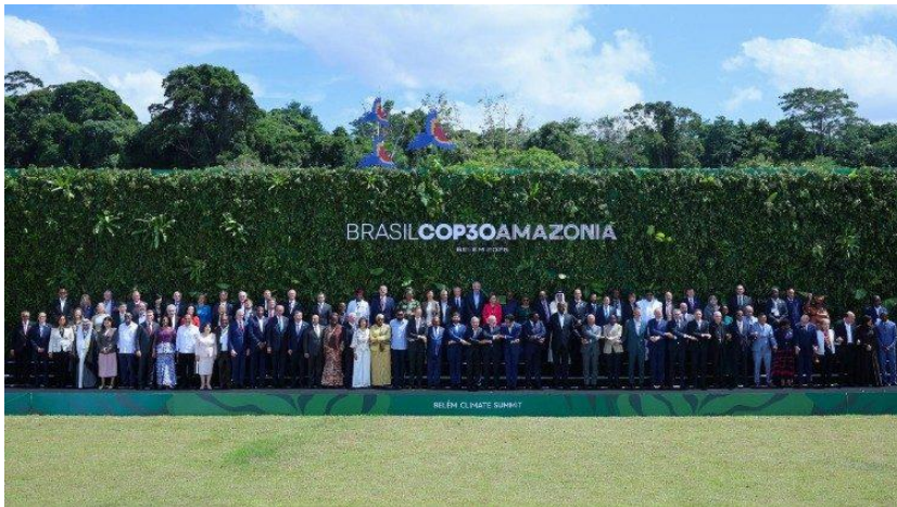
Líderes participantes da Cúpula do Clima - COP30

Ainda na sessão, o secretário-geral das Nações Unidas, António Guterres, ressaltou que a proteção das florestas e dos oceanos é fundamental para garantir a estabilidade climática, preservar a biodiversidade e assegurar a sobrevivência de milhões de pessoas. “Proteger florestas e oceanos não é um ato de caridade, mas uma responsabilidade legal e moral, e também uma decisão economicamente inteligente”.