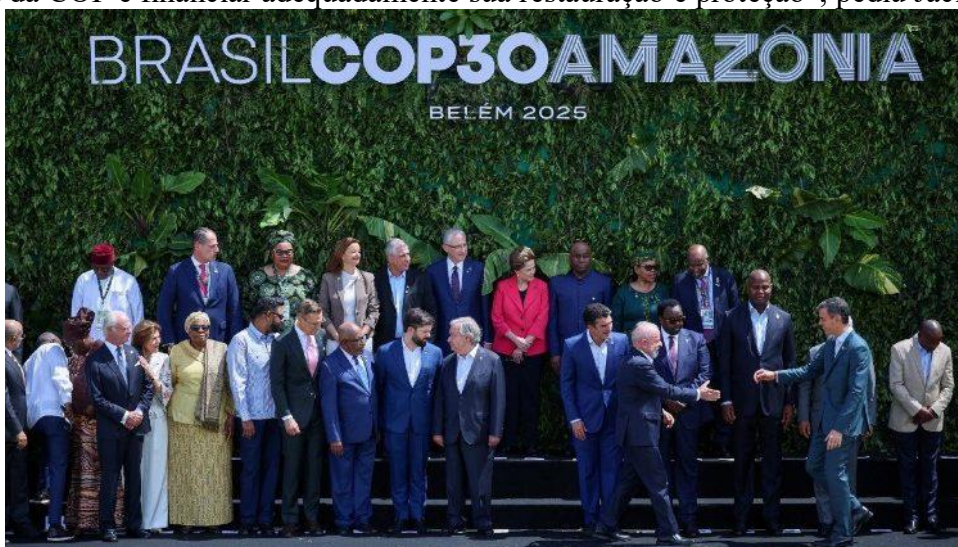
Foto de grupo

A Enviada Especial da Oceania, Jacinda Arden, também presente nesta sessão temática, afirmou que a abordagem em relação ao oceano e ao clima tem sido fragmentada mesmo nos dias atuais. “É hora de integrar 71% da superfície da Terra, o grande estabilizador do meio ambiente e da Terra, à agenda da COP e financiar adequadamente sua restauração e proteção”, pediu Jacinda.