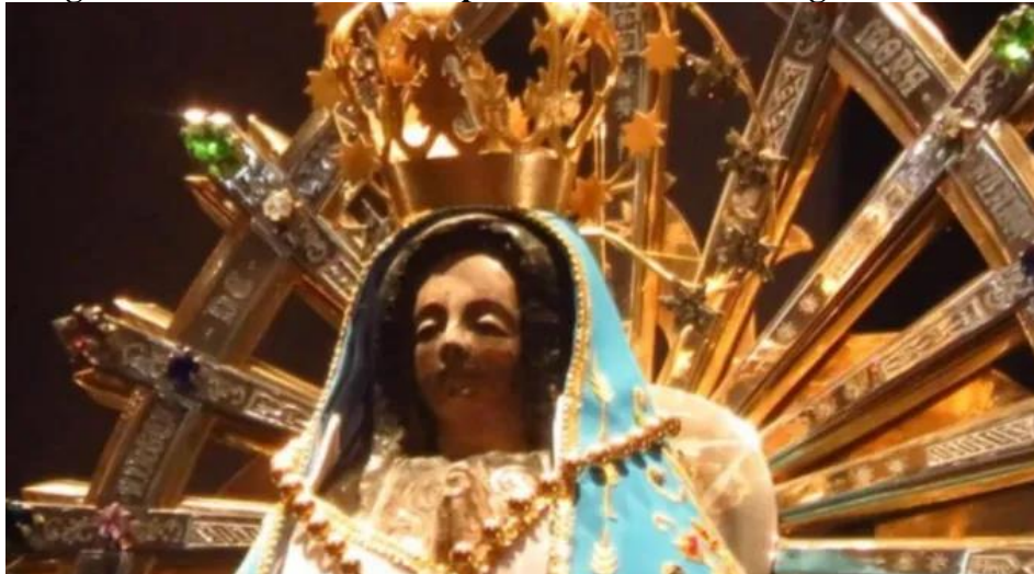
Imagem de Nossa Senhora e capela é incendiada na Argentina no halloween