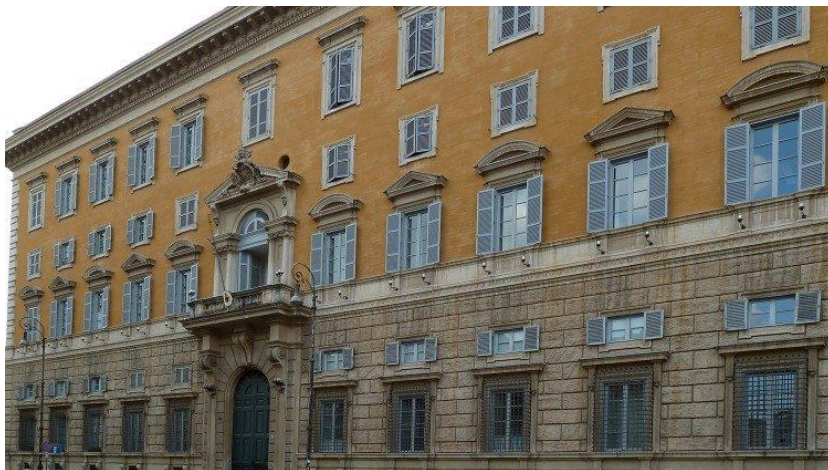
Dicastério para a Doutrina da Fé