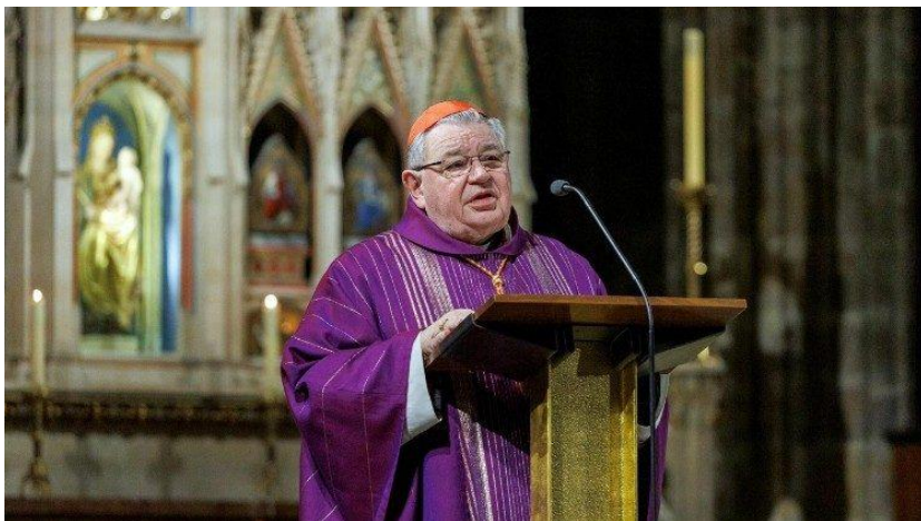
Cardeal Dominik Duka