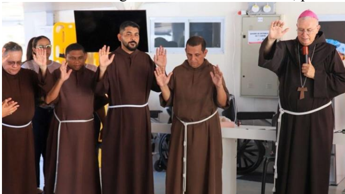
A bênção aos 86 multiprofissionais que irão atender de 7 a 12 de novembro na COP 30

Agradecemos aos governos estaduais do Pará e do Amazonas pelo apoio que estão dando, sobretudo pela parceria que temos com os dois barcos – e são milhares de pessoas que procuram melhorar a saúde. Nosso coração está cheio de gratidão por todos aqueles que ajudam, os colaboradores e colaboradoras, os médicos e médicas, e os voluntários que se colocam à disposição para ajudar. Assim, estamos com uma grande corrente de caridade, pois a caridade jamais pode parar.”