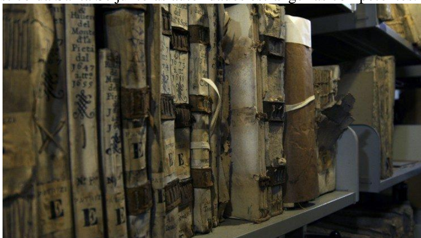
Arquivo Apostólico Vaticano