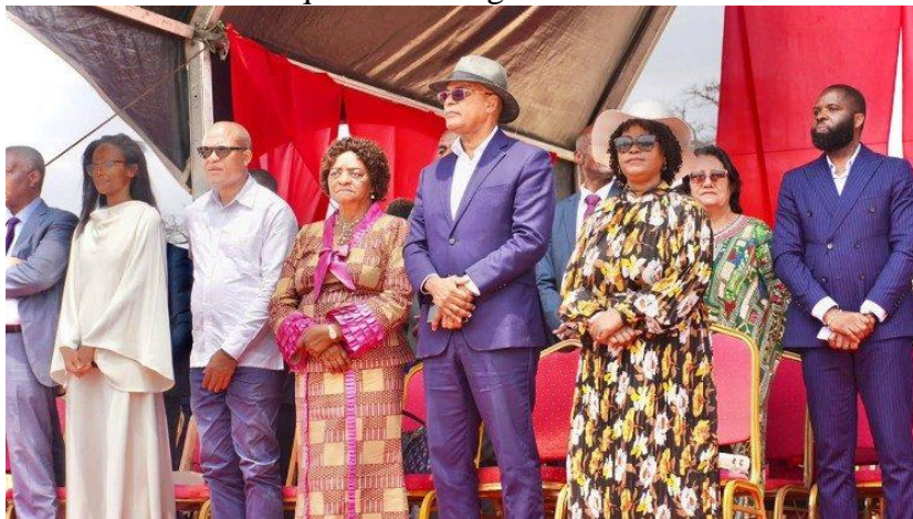
Grupo de políticos angolanos que participam no debate sobre a reconciliação nacional

O evento servirá como um momento de "Introspecção" e "Escuta", com o propósito de incentivar uma reflexão nacional sobre o percurso histórico de Angola desde a independência, em 1975, e os 23 anos de paz efectiva. Esta análise será feita por categorias sociais e classes profissionais, permitindo que diferentes segmentos da sociedade (políticos, empresários, intelectuais, sociedade civil) possam assumir e discutir os erros e acertos que "desconfiguraram a nossa estrutura social, cultural e familiar".