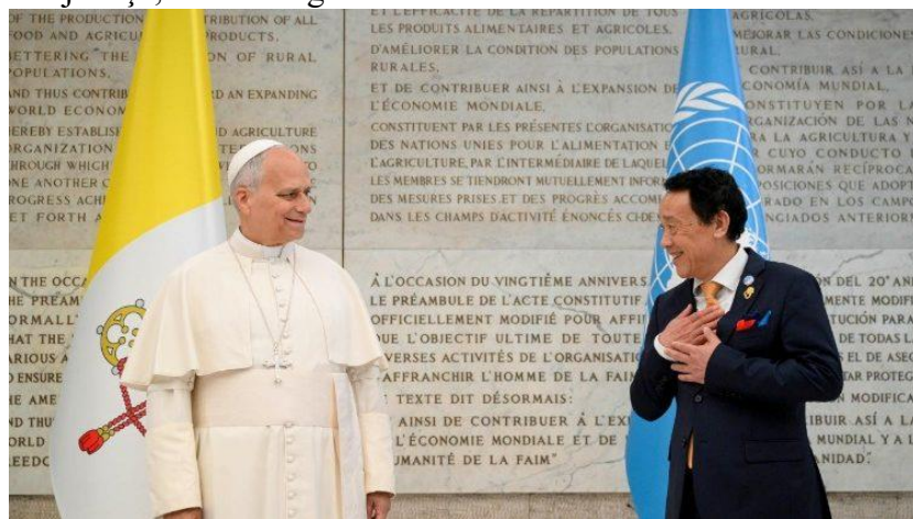
Papa durante sua visita

O Pontífice destacou também o papel essencial da mulher na luta contra a fome. “As mulheres são as primeiras a velar pelo pão que falta, a semear esperança nos sulcos da terra e a amassar o futuro com as mãos calejadas pelo trabalho.” Reconhecer e valorizar esse papel, disse ele, “não é apenas uma questão de justiça, mas uma garantia de um modo de vida mais humano e sustentável.”