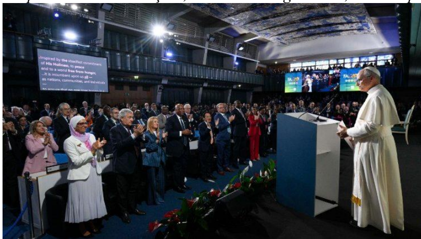
Papa Leão recebe os aplausos da assembleia da FAO

“A fome não é o destino do homem, mas a sua ruína. É um grito que sobe ao céu e exige resposta rápida de todas as nações, de todos os organismos, de cada pessoa.”