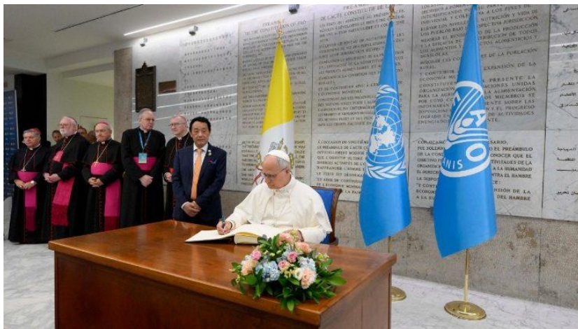
Leão XIV na sede da FAO em Roma