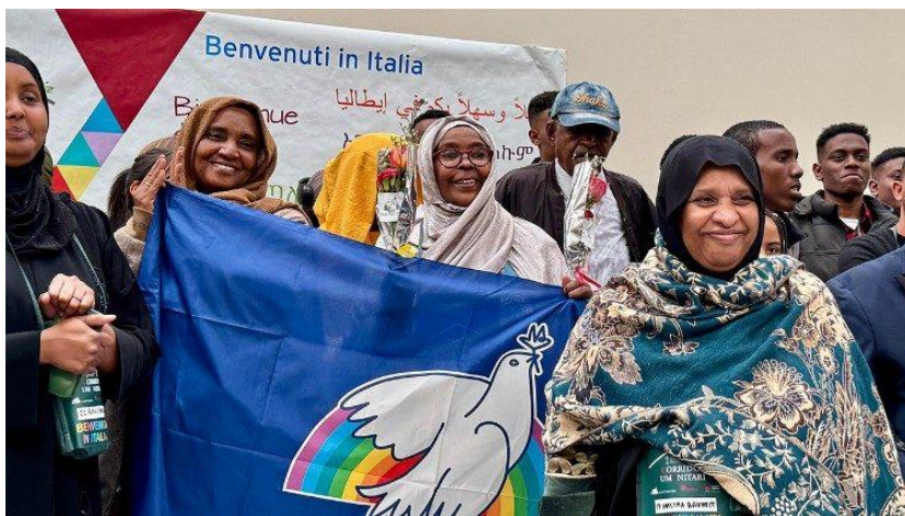
44 refugiados da Etiópia graças aos corredores humanitários.

Parece sempre uma gota no mar, números pequenos, pouco alarde, mas, desde 2016, data do início dos corredores humanitários por parte de Sant'Egidio, com a colaboração da Conferência Episcopal Italiana, CEI, da Federação das Igrejas Evangélicas Italianas e da Mesa Valdense, mais de 8.600 pessoas, entre as quais muitas crianças, chegaram à Europa em segurança, mais de 7.200 foram acolhidas em Itália sãs e salvas e tornaram-se testemunhas de renascimento. Nesta quinta-feira, foi a vez de um grupo de 44 refugiados provenientes da Etiópia que, na sequência da guerra civil no Sudão, se tornou, seu malgrado, terra de imigração.