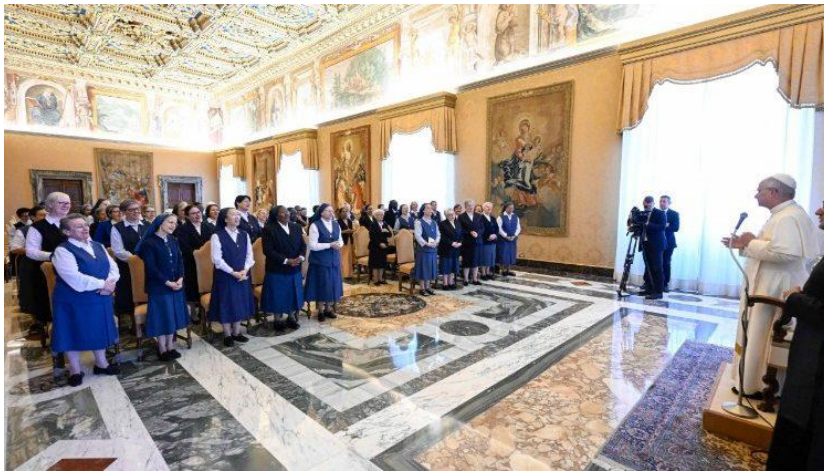
A audiência foi na Sala do Consistório, no Vaticano

“Queridas irmãs, é um serviço precioso o que vocês oferecem ao mundo e à Igreja, trabalhando na produção editorial, no universo digital, na gestão das livrarias, nos projetos de rádio e televisão e na animação bíblica. Sei que os esforços para levar adiante essas múltiplas atividades às vezes são pesados, sobretudo porque as complexas situações atuais exigem uma formação profissional de alta qualidade que, infelizmente, às vezes se choca com o fato de que as forças, pessoais e materiais, são escassas. Mas não nos deixemos desanimar!”