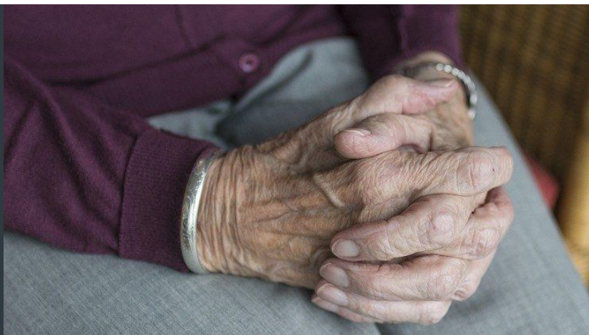
O cardeal Farrell abriu o II Congresso Internacional sobre a Pastoral da Pessoa Idosa

O aumento da expectativa de vida é um dos sinais da "mudança de época" em curso. Por um lado, o crescimento da população idosa é percebido como uma "emergência a ser administrada", um fardo para a sociedade. Por outro, a Igreja nos convida a reconhecer a longevidade como um "dom" divino, que exige "respostas pastorais adequadas", capazes de valorizar a contribuição dos idosos. Com estas palavras, o cardeal Kevin Joseph Farrell, prefeito do Dicastério para os Leigos, a Família e a Vida, abriu esta quinta-feira, 2 de outubro, o II Congresso Internacional sobre a Pastoral da Pessoa Idosa, em andamento na Cúria Jesuíta.