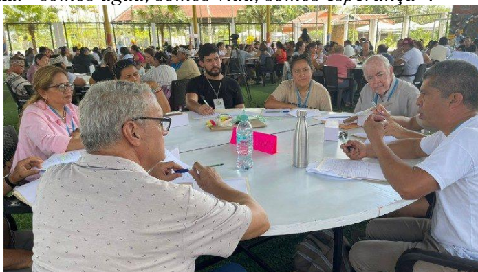
Cúpula Amazônica da Água

O segundo cenário citado por Miguel Cadenas foi a situação vivida pelos assentamentos humanos 21 de Setembro e Iván Vásquez, no distrito de Punchana-Iquitos. "Os moradores desses assentamentos vivem em um esgoto a céu aberto, com uma sentença do tribunal constitucional que não é cumprida" . As mais de 4.000 pessoas da região veem como o acesso à água potável está longe de se concretizar e como os resíduos de um hospital, de um posto de gasolina e de um CAMAL (matadouro municipal) circulam pelo setor, gerando problemas de saúde em crianças, jovens e adultos. Dom Miguel Ángel Cadenas qualificou a cúpula como um espaço de ousadia, no qual deve ser reafirmada a consigna: "somos água, somos vida, somos esperança" .