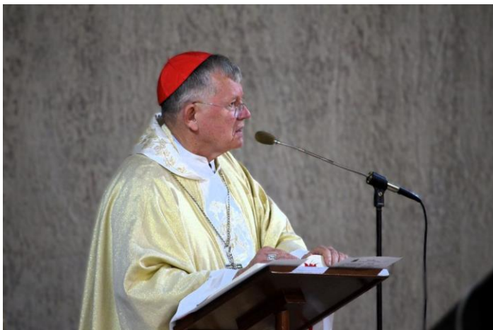
Cardeal Jaime Spengler, presidente da CNBB

Dom Jaime destacou, de modo particular, que a presença dos sacerdotes em Roma não se deve a um projeto pessoal, mas ao envio de um presbitério e de uma Igreja local, que confiam a cada um a missão de aprofundar a formação acadêmica e espiritual em vista do serviço ao Povo de Deus. Trata-se, portanto, de um chamado que requer fidelidade, simplicidade e plena consciência de que toda vocação nasce e amadurece na comunhão eclesial.