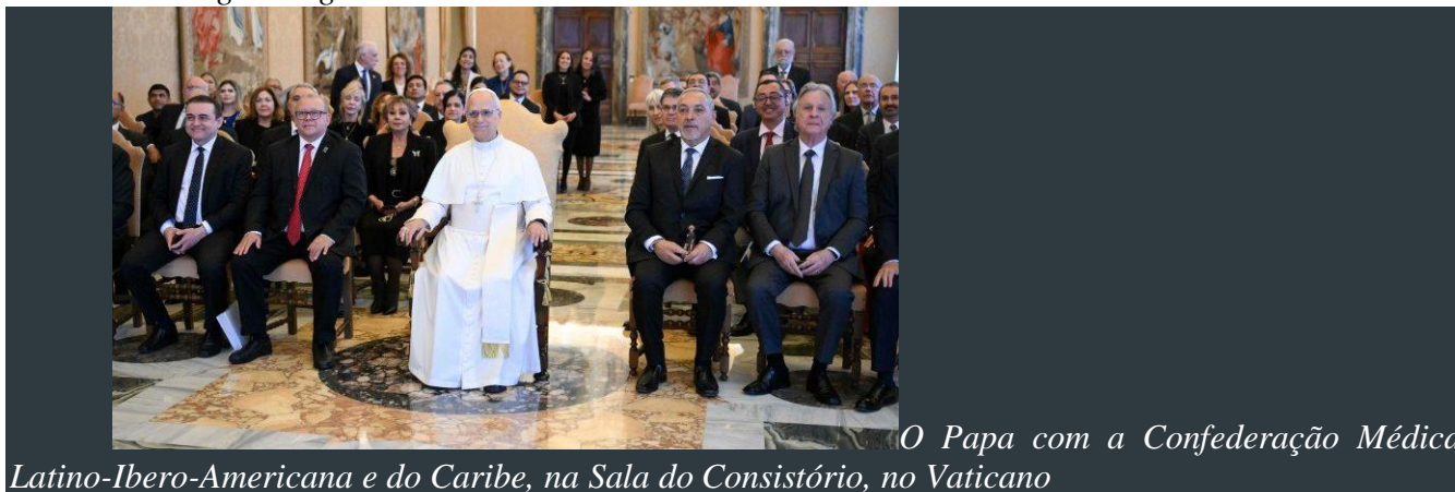
O Papa com a Confederação Médica Latino-Ibero-Americana e do Caribe, na Sala do Consistório, no Vaticano

O Papa Leão XIV recebeu em audiência, nesta quinta-feira (02/10), no Vaticano, os representantes da Confederação Médica Latino-Ibero-Americana e do Caribe (CONFEMEL), uma organização que representa mais de dois milhões de médicos que trabalham para levar assistência médica de qualidade a todos os cantos de seus países.