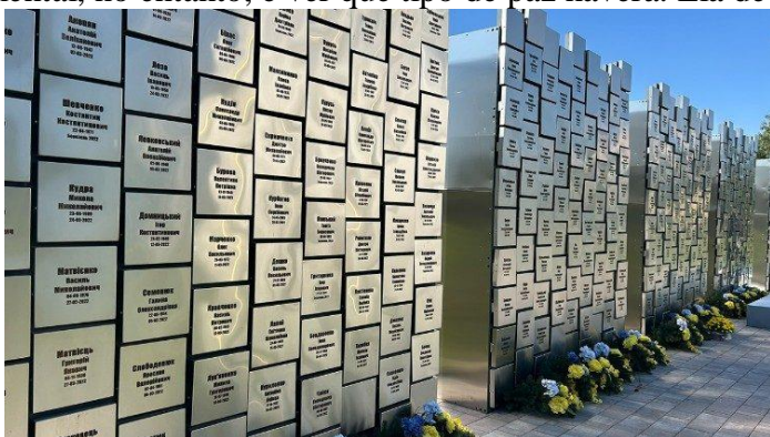
O memorial em Bucha

Em nossa comunidade, nos ajudamos muito, uns aos outros. Também eu recebo grande apoio emocional dos outros. E sempre digo que, mais cedo ou mais tarde, o momento do perdão chegará. Não podemos viver cheios de ódio, mas também não podemos, por assim dizer, fechar definitivamente com o passado. Quando esse perdão acontecerá? Ainda não estamos prontos para isso. Posso dizer que provavelmente estaremos prontos para perdoar quando os russos estiverem prontos para pedir perdão. Mas quando isso acontecerá? Ninguém sabe. Jornalistas, assim como pessoas que vêm aqui, nos perguntam se podemos perdoar os russos. Eu sempre respondo a essa pergunta com outra pergunta: vocês acham que os russos querem o nosso perdão? Eles realmente precisam? Ninguém o está pedindo agora. Para nós, o mais importante agora é que esta guerra acabe. E rezamos pela paz. A questão fundamental, no entanto, é ver que tipo de paz haverá. Ela deve ser justa.