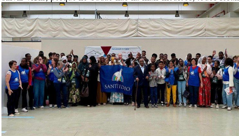
Jubileu dos migrantes: 44 refugiados da Etiópia graças aos corredores humanitários

Entre esses 44 refugiados, há também alguns eritreus e 17 somalis que sofreram violência brutal por parte das milícias islâmicas. Em seus rostos, a alegria de um caminho de esperança recém-traçado, mas ainda mais, continua Pompei, “os sinais de sofrimentos indescritíveis: rostos marcados, provados, cansados”. A maioria são adultos que tinham um emprego, uma profissão e estavam bem do ponto de vista econômico e social em seu país natal. Muitos eram médicos e, de repente, após o início da guerra no Sudão entre 2021 e 2022, se viram sem nada, “refugiados comuns cujo destino não interessa a ninguém”. No entanto, expressaram gratidão por quem abriu essa passagem no deserto, manifestaram preocupação por quem ficou e desejo de ajudar, de se tornarem, por sua vez, instrumentos de acolhimento. “Fiquei impressionada com uma jovem de 17 anos, que chegou a Roma com a família, e me disse: quero me tornar médica e depois voltar ao meu país para ajudar, colocar-me à disposição dos outros, salvar vidas, porque no Sudão não há mais médicos, todos foram mortos”.