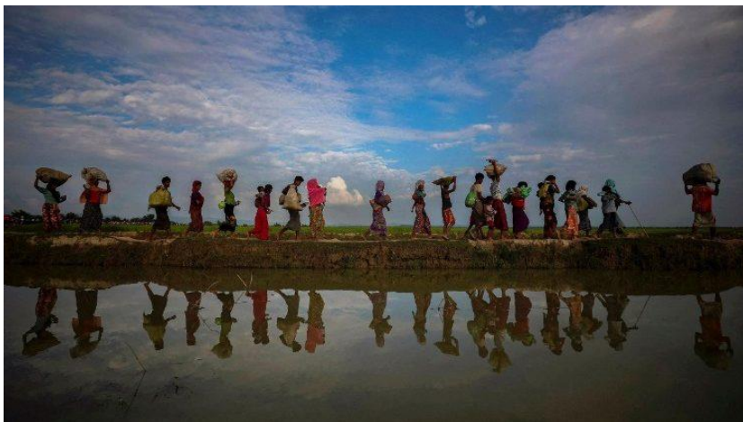
Refugiados rohingya em Mianmar

O secretário para as Relações com os Estados e as Organizações Internacionais, dom Paul Richard Gallagher, divulgou números significativos durante a Conferência de Alto Nível sobre a situação dos muçulmanos rohingya e outras minorias em Mianmar, realizada nas Nações Unidas, em Nova York.