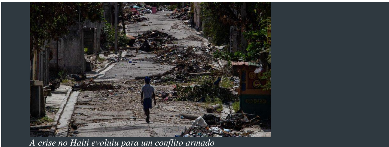
A crise no Haiti evoluiu para um conflito armado

O relatório anual sobre conflitos, direitos humanos e oportunidades para a paz, feito pelo Centro de Pesquisa para uma Cultura de Paz da Universidade Autônoma de Barcelona, registra um aumento sem precedentes de guerras globais nos últimos 12 anos. O documento, baseado em dados divulgados pelas principais agências e organizações internacionais, analisa o estado global dos conflitos armados, tensões sociopolíticas e iniciativas de construção da paz, destacando tendências, riscos e oportunidades para a paz no futuro. Em 2024, o número de conflitos armados aumentou para 37, em comparação com 36 em 2023. A maioria dos conflitos concentra-se na África (17), seguida pela Ásia e Pacífico (10), Oriente Médio (6), Europa (2) e América (2). Dois contextos degeneraram de crise sociopolítica para