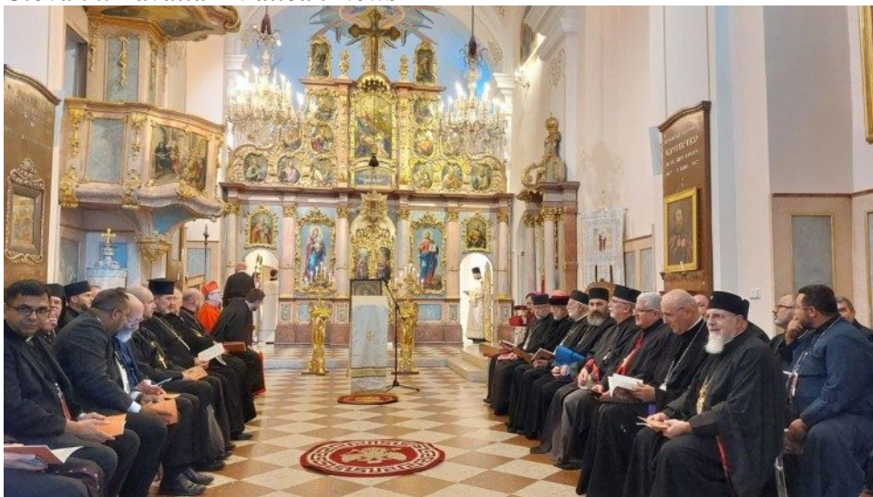
Viena, a Assembleia dos Bispos Católicos Orientais da Europa

As três dimensões da comunhão eclesial na Europa (com o Bispo de Roma, das Igrejas Católicas Orientais sui iuris entre si e dos católicos orientais com a Igreja de rito latino) marcaram as sessões de trabalho da assembleia anual dos bispos católicos orientais da Europa realizada, em Viena, na Áustria, de 8 a 11 de setembro. O encontro, sob o tema "Unidade na diversidade", reuniu mais de sessenta e cinco prelados e mais de cem representantes. Organizada sob o patrocínio do Conselho das Conferências Episcopais Europeias (CCEE), a assembleia foi realizada no 250º aniversário do "Barbareum", o seminário greco-católico fundado na capital austríaca pela Imperatriz Maria Teresa. Entre os presentes estavam o arcebispo-mor de Kiev-Halyč, Sua Beatitude Sviatoslav Shevchuk, pela