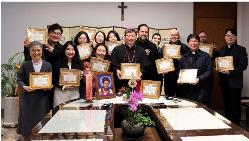
Relíquia de Carlo Acutis na sede do Comitê Organizador da JMJ Sel 2027