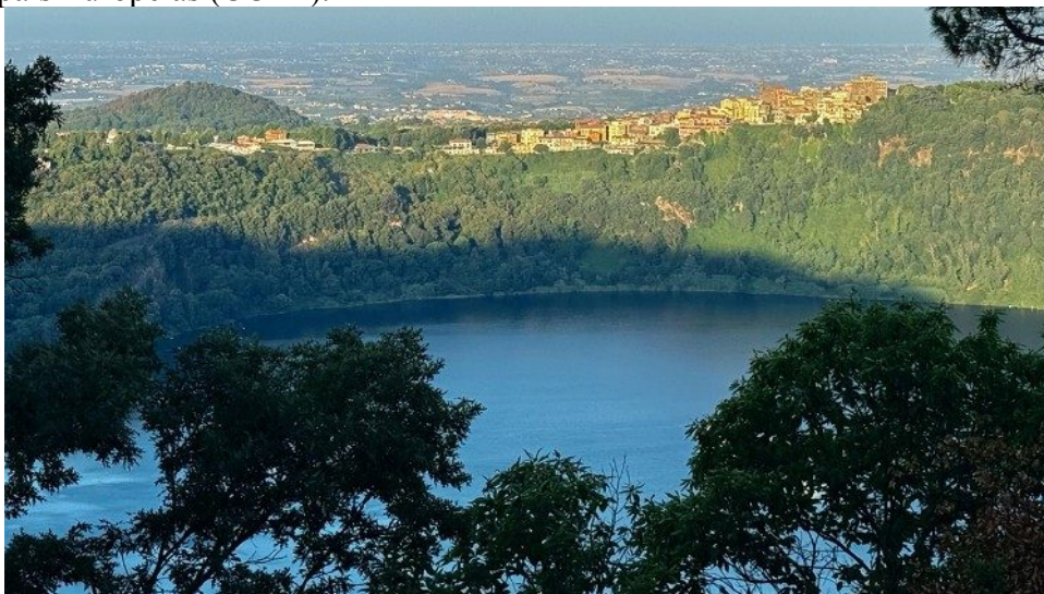
Vista panorâmica da cidade de Castel Gandolfo, a partir da Villa Barberini

Dez anos após o Papa Francisco publicar a Encíclica Laudato si' , o inovador documento é a principal inspiração para um encontro que discute a missão ecológica da Igreja e o chamado ao cuidado da nossa casa comum. De 19 a 21 de setembro, a cidade de Castel Gandolfo sediará o Encontro da Seção para a Salvaguarda da Criação, que pertence à Pastoral Social do Conselho das Conferências Episcopais Europeias (CCEE).