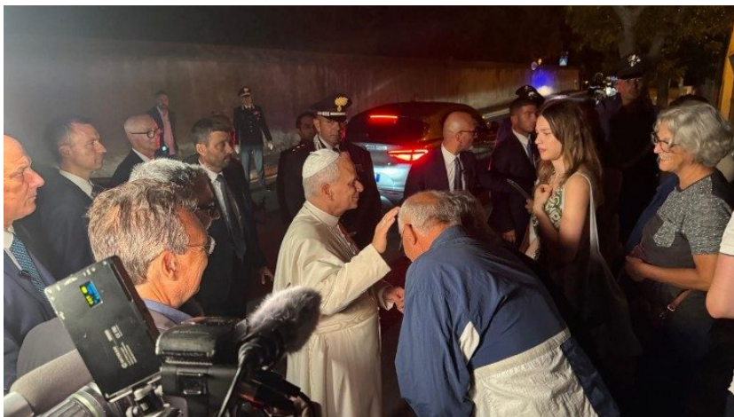
Papa abençoa fiel antes de regressar ao Vaticano

Quando questionado sobre as declarações do Kremlin a respeito de uma guerra entre a OTAN e a Rússia, o Pontífice ressalta que “a OTAN não iniciou nenhuma guerra, os poloneses estão preocupados porque sentem que seu espaço aéreo foi invadido, é uma situação muito tensa”. “A preocupação é grande”, revela.