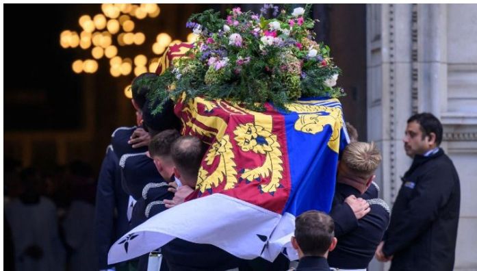
O caixão da Duquesa de Kent, Katharine

Em um telegrama, o Papa apresentou suas mais profundas condolências ao Rei Carlos III pela morte da Duquesa de Kent, Katharine, na noite de 4 de setembro, no Palácio de Kensington. Ela tinha 92 anos.