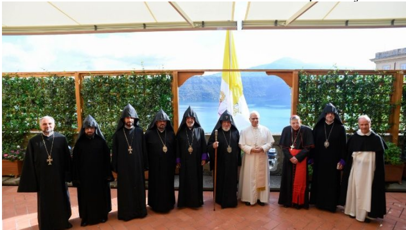
A foto do Papa com Karekin II e sua delegação

Primeira visita ao Vaticano em 2000 e a Declaração conjunta