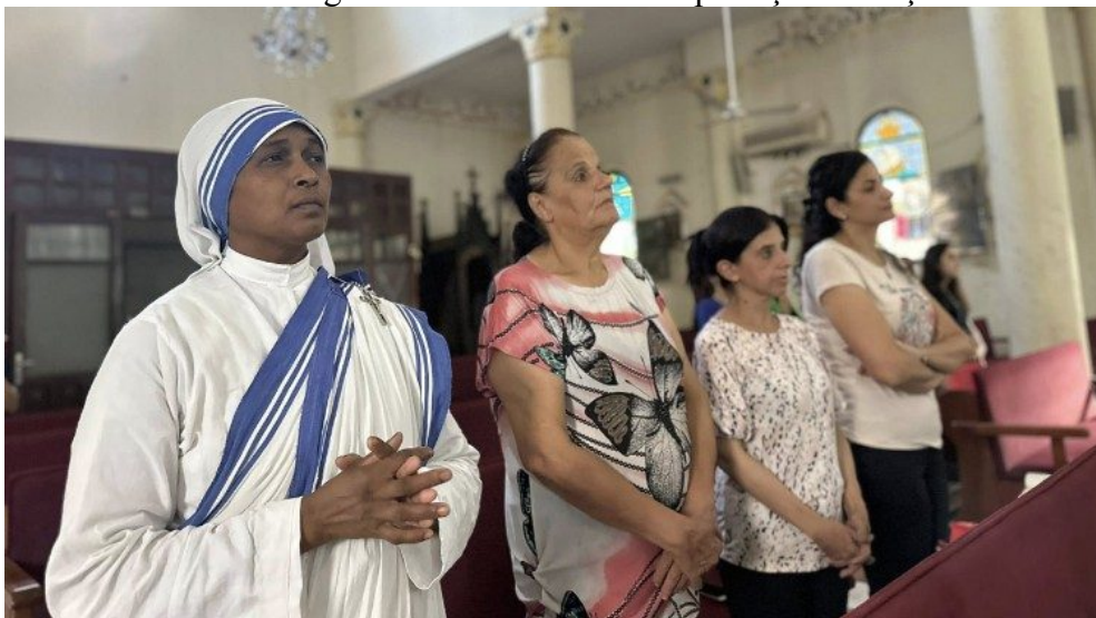
Os fiéis reunidos em oração na igreja da Sagrada Família

bênção da entrega, nestes dias, a “65 pessoas, entre crianças, adolescentes, jovens e adultos, do escapulário da Santíssima Virgem Maria como sinal de proteção e bênção”.