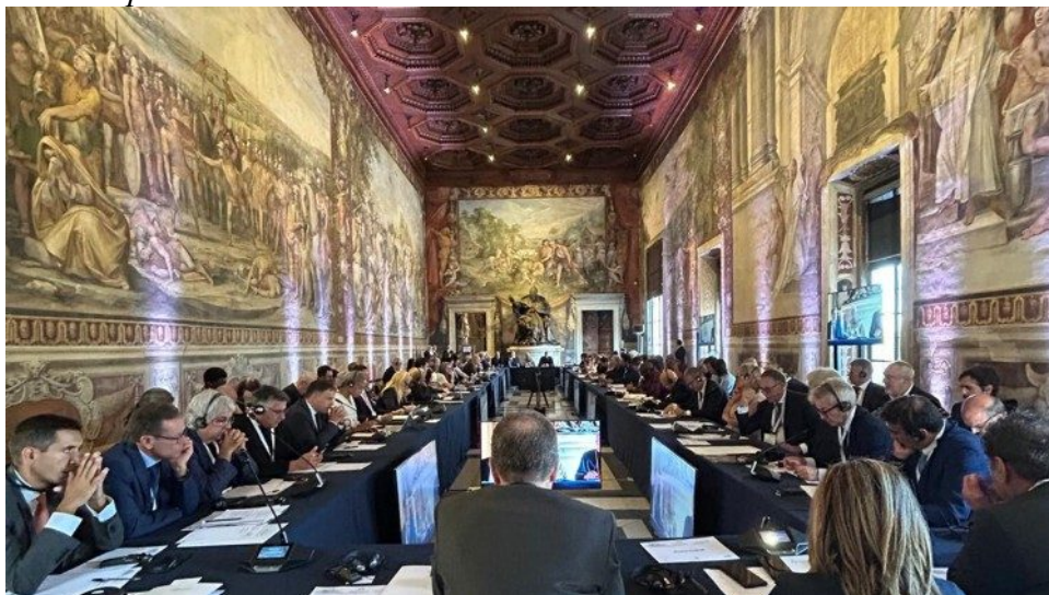
A "Assembleia do Humano" realizada no Capitólio, em Roma

O conceito de dignidade é o primeiro “espaço” de reflexão identificado no III Encontro Mundial sobre Fraternidade Humana, promovido pela Basílica de São Pedro, pela Fundação Fratelli tutti e pela associação Be Human , que nos últimos dois dias transformou Roma em um laboratório ideal do humano: 450 pessoas para falar sobre recursos, 100 administradores locais, cerca de 30 Prêmios Nobel, 15 mesas temáticas, um debate entre representantes dos principais jornais mundiais; empresários, economistas, acadêmicos, operadores sociais, estudantes, esportistas, líderes espirituais que se reuniram para coletar boas práticas, compartilhar experiências e propor ações concretas.