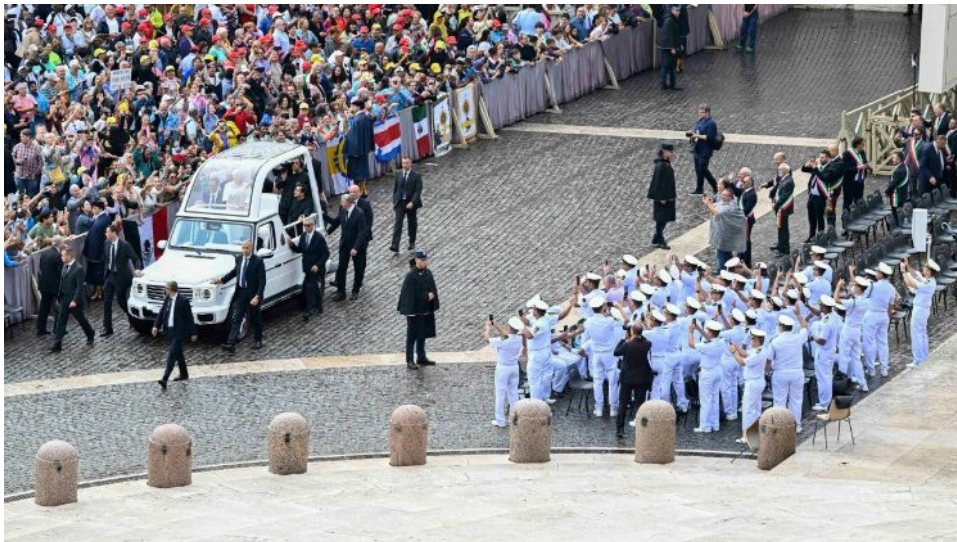
O grupo de 50 pessoas do Navio-Escola Brasil presente na Praça São Pedro