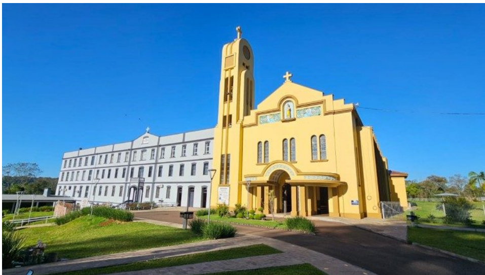
O Santuário Nossa Senhora da Salette de Marcelino Ramos, no Rio Grande do Sul

Dentro da dinâmica do Ano Jubilar, o Santuário Nossa Senhora da Salette de Marcelino Ramos é uma “Igreja Jubilar” e, para bem atender todos os peregrinos, diversos sacerdotes estarão atendendo Confissões, de modo que todos possam garantir, a partir do prescrito, a Indulgência Plenária.