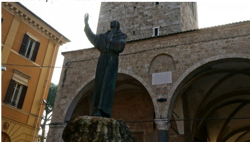
Catedral de Nossa Senhora em Rieti

Na homilia proferida na tarde de terça-feira, 9 de setembro, na Catedral de Nossa Senhora, em Rieti, pelo secretário de Estado Vaticano, cardeal Pietro Parolin, o purpurado referiu-se a acontecimentos atuais, referências precisas à realidade da Igreja em Rieti e indicações valiosas para o futuro. A missa insere-se no âmbito do Jubileu e foi celebrada por ocasião do aniversário de 800 anos da dedicação da Catedral em 9 de setembro de 1225, pelo Papa Honório III. A Catedral voltou ao seu esplendor após as obras de restauração realizadas depois do terremoto de 2016.