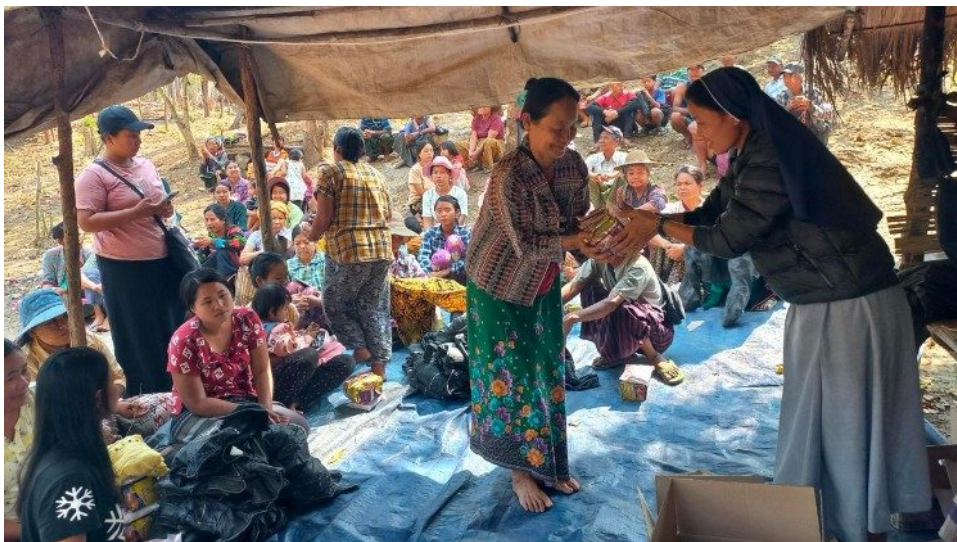
Uma freira birmanesa distribui alimentos em um campo de refugiados.