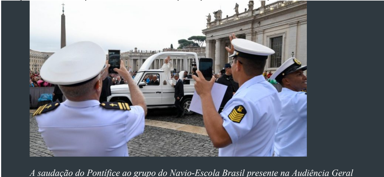
A saudação do Pontífice ao grupo do Navio-Escola Brasil presente na Audiência Geral

"Uma afetuosa saudação aos fiéis de língua portuguesa! Caríssimos: não há amor maior do que o de Jesus na cruz, oferecendo-se ao Pai por cada um de nós. Abramos sem medo os nossos corações a este amor que é a razão da nossa esperança. Deus vos abençoe!"