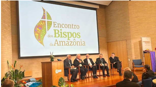
Encontro da CEAMA