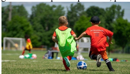
Crianças brincando de jogar futebol

A este respeito, qual o ponto de vista dos Papas sobre o futebol? Para eles, deve ser visto, antes de tudo, como um jogo de equipes, mas também como meio de fomentar amizades e sonhos, como os que surgem nos campos de periferia, paróquias e oratórios.