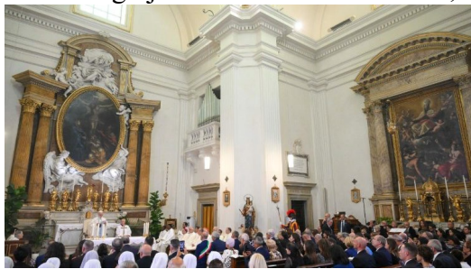
Santa Missa em Castel Gandolfo

Refletindo sobre o Evangelho da Visitação, proposto pela liturgia para esta Solenidade, o Papa destacou que, no encontro de Maria com Isabel, “a surpreendente fecundidade da estéril Isabel confirmou Maria na sua confiança: antecipou a fecundidade do seu ‘sim’, que se prolonga na fecundidade da Igreja e de toda a humanidade, quando a Palavra renovadora de Deus é acolhida”.