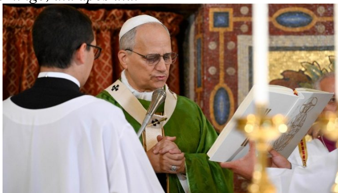
Missa presidida pelo Papa Leão

“Cada um de nós vem à igreja com alguns cansaços e medos – às vezes pequenos, outras vezes grandes – e imediatamente sentimo-nos menos sozinhos, estamos juntos e encontramos a Palavra e o Corpo de Cristo. Deste modo, o nosso coração recebe uma vida que vai para além da morte. É o Espírito Santo, o Espírito do Ressuscitado, que faz isto entre nós e em nós, silenciosamente, domingo após domingo, dia após dia.”