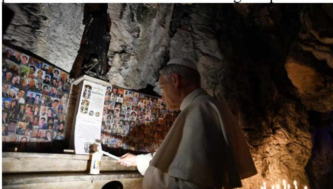
Um momento da visita do Papa ao Santuário de Mentorella

tradições remontam a fundação do Santuário ao tempo do imperador Constantino. Foi também lugar de oração para São Bento — e ali ainda resta a gruta por ele habitada — e para São Gregório Magno.