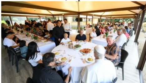
Papa Leão XIV durante o almoço com os mais necessitados

Após a oração do Angelus, o Papa Leão XIV participou de um almoço no Borgo Laudato si' , em Castel Gandolfo, no "Pavilhão do Repouso", junto a cerca de 110 pessoas em situação de vulnerabilidade social, entre acolhidos de casas de assistência, moradores de rua e usuários dos Centros de Escuta. Estiveram presentes também o cardeal Fabio Baggio, subsecretário do Dicastério para o Serviço do Desenvolvimento Humano Integral, o bispo de Albano, dom Vincenzo Viva, além das autoridades civis locais, representantes da Cáritas, incluindo sacerdotes e religiosas da diocese.