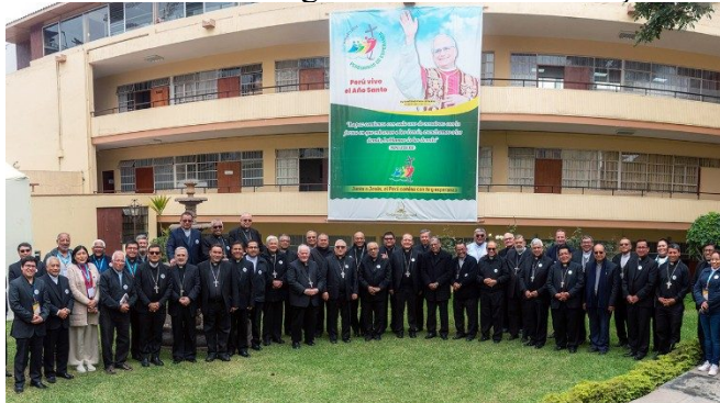
Os participantes do encontro da Conferência Episcopal Peruana