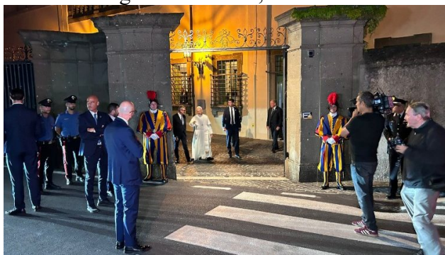
O Papa ao sair da Villa Barberini

Já estava escuro quando, a pé, atravessou o portão da Villa Barberini e se deteve para conversar com alguns fiéis. Logo depois, o Pontífice não se esquivou das perguntas dos jornalistas e, a respeito de possíveis conversas com alguns líderes, disse que “alguém” os escuta “continuamente”. “Rezemos e busquemos como seguir em frente”, acrescentou.