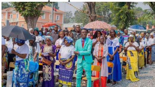
Milhares de fiéis na celebração do jubileu de ouro da diocese de Saurimo