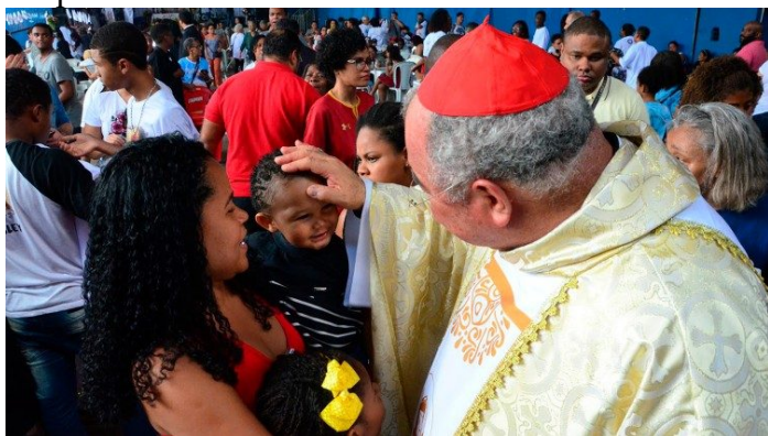
Dom Orani e o seu rebanho

Dom Orani não é apenas um arcebispo. É sorriso que ilumina e gestos que falam mais que mil palavras. É o amigo das praças e das vielas, dos altares e das ruas esquecidas. É voz que conforta, olhar que acolhe, presença que se inclina sobre os humildes como quem se aproxima de um tesouro sagrado. Seu ministério no Rio de Janeiro sempre foi feito de proximidade: ouvir as alegrias, carregar as dores, partilhar o pão do consolo.