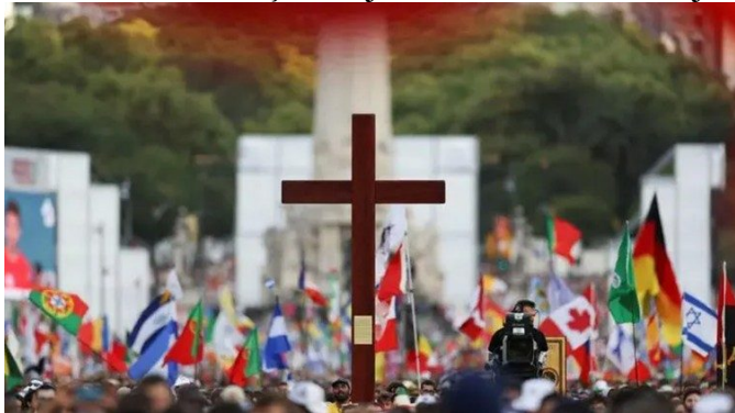
Discernimento sobre o magistério da Igreja Compromisso e esperança para o futuro

O dia se concluirá com um painel sobre "O papel da Igreja e da cidadania no marco político 2025-2026", com a participação da historiadora Carmen McEvoy, do arcebispo de Trujillo, dom Alfredo Vizcarra, e da líder social Yolanda Flores, da cidade de Puno. O painel de encerramento será conduzido pelo cardeal Carlos Castillo, que refletirá sobre o papel da Igreja no atual contexto democrático, com moderação do jornalista Carlos Cornejo.