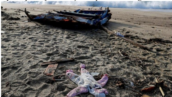
Praia de Cutro, na Calábria, palco de um naufrágio dramático em 2023.

Degolados pela brutalidade do EI, morreram dizendo: “Senhor Jesus!”, confessando o nome de Jesus. É verdade que há uma tragédia, que estas pessoas deixaram a vida na praia; mas também é verdade que a praia foi abençoada pelo seu sangue.