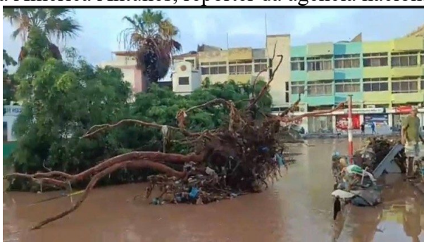
Ilha de São Vicente

“Coisa nunca vista”, “parecia o fim do mundo” é a opinião que mais se ouve entre a população - afirma América Antunes, repórter da agência nacional de notícias.