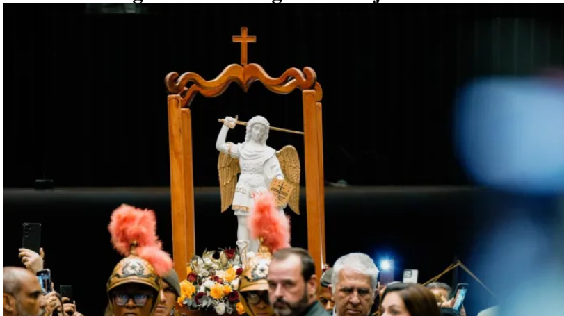
Imagem peregrina oficial de são Miguel Arcanjo entrando no plenário do Congresso Nacional | Instituto Hesed