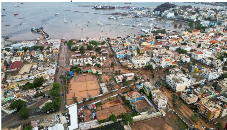
Enxurradas em São Vicente

A três dias desse triste evento, numa ilha, onde a chuva costuma ser motivo de alegria e festa por ser rara e escassa, Dom Ildo Fortes, que é também Presidente da Cáritas de Cabo Verde, traça para a Vatican News um balanço.