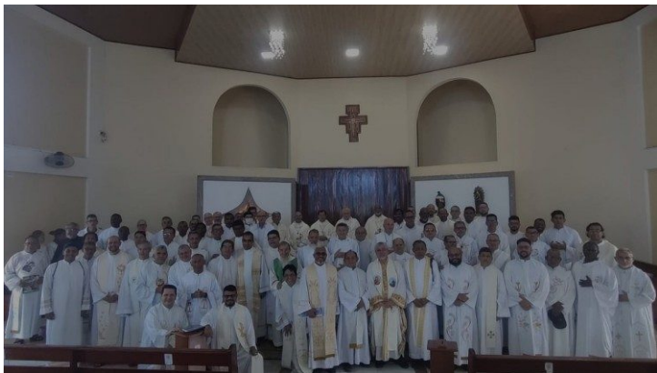
Jubileu dos Ministros ordenados

Segundo o arcebispo de Manaus, cardeal Leonardo Ulrich Steiner, “é o fato de termos sido salvos e redimidos que vivemos a esperança. A esperança de que a redenção acontecida nos ilumina, nos fortalece, nos aquece e sempre de novo nos coloca a caminho. É o caminho da misericórdia e da bondade.”. Nessa perspectiva, a importância da celebração penitencial, pois “reconhecer a fraqueza é reconhecer o amor, reconhecer o amor é reconhecer a fraqueza, é reconhecer que fomos salvos e redimidos”, fazendo um chamado a buscar o perdão e a misericórdia. Juno com isso, que o Ano Santo “fortaleça nosso ministério, ajude a nos colocarmos cada vez mais a caminho para bem servir às comunidades e sermos anúncio do Reino novo, o Reino da Salvação”.