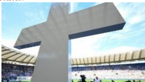
A instituição em 2024

O Pontifício Comitê para a Jornada Mundial da Criança, criado no ano passado por Francisco para organizar e coordenar as Jornadas Mundiais da Criança, foi transferido para o Dicastério para os Leigos, a Família e a Vida. A decisão foi tomada pelo Papa Leão XIV após a audiência concedida ao substituto da Secretaria de Estado, dom Edgar Peña Parra, em 6 de agosto, publicada num Rescrito. O documento, divulgado nesta quarta-feira (13/08), datado de sábado, 9, especifica que: "A Disposição Superior será notificada às duas instituições envolvidas para que organizem as operações de transferência."