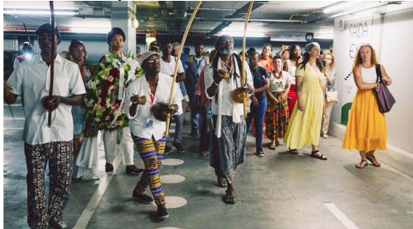
Escravidão como tema na ordem do dia