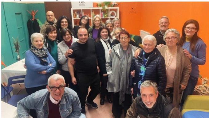
Usuários dos serviços da Caritas de Albano

Aqui, predominam as chamadas famílias "working poor" — pessoas que, apesar de trabalharem, não conseguem sustentar as famílias devido a problemas de saúde ou relacionados ao trabalho. Essas famílias não conseguem chegar ao fim do mês, então recebem auxílio-alimentação das nossas lojas. Uma delas, por exemplo, fica em Genzano.