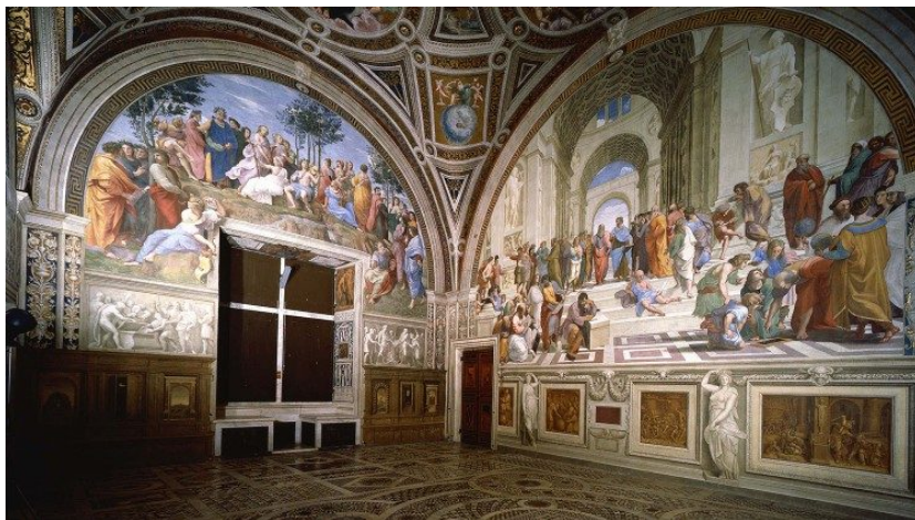
Os Quartos de Rafael

Completar o ciclo com a sala "Fogo no Borgo" é um dos seus sonhos: "Penso sempre em Rafael, pois trabalhei nessas salas durante 17 anos. A restauração da sala "Fogo no Borgo", explica, "está apenas começando, mas ainda não está concluída". Abordá-la significaria explorar "um momento importante na transição entre Rafael e a sua oficina". Significaria, portanto, "compreender melhor os afrescos da Sala de Constantino", recentemente devolvida ao público, pintados pelos alunos Giulio Romano e Giovanni Francesco Penni.