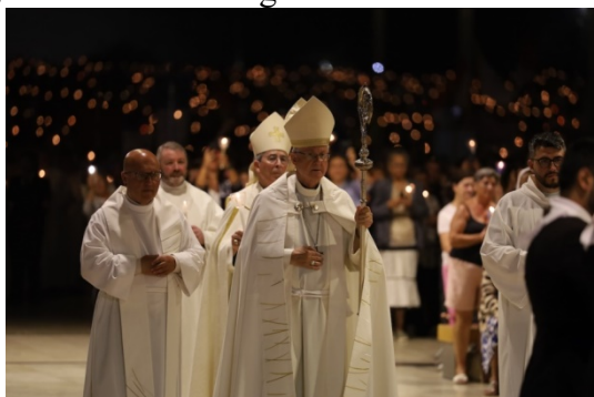
Procissão das Velas na Peregrinação de 12 e 13 de Agosto de 2025

A Peregrinação Nacional do Migrante e do Refugiado a Fátima, nos dias 12 e 13 de agosto, é presidido por D. Joan-Enric Vives i Sicília, bispo emérito de Urgel, diocese espanhola de que faz parte o Principado de Andorra, e insere-se na Semana Nacional das Migrações, promovida pela Obra Católica Portuguesa de Migrações, da Conferência Episcopal Portuguesa, entre os dias 10 e 17 de agosto, sobre o tema “Migrantes Missionários da Esperança”.