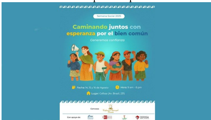
Detalhes da Semana Social 2025

Durante a cerimônia, será lida a Declaração Final da Semana Social. Este documento reunirá as conclusões e os compromissos assumidos durante o encontro, reafirmando o compromisso cristão com o bem comum no contexto do próximo processo eleitoral.