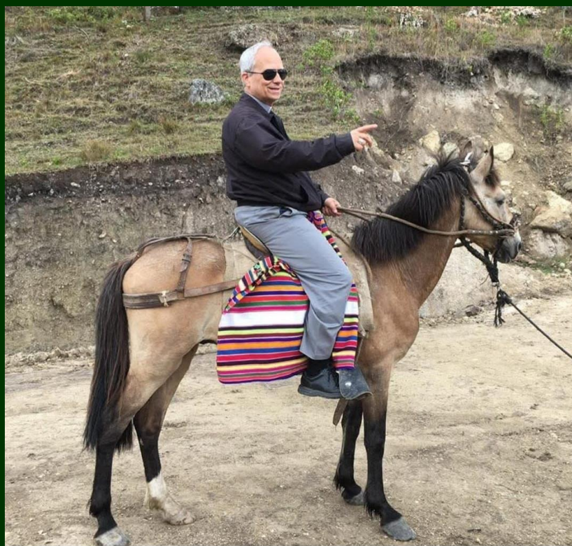
Papa Leão XIV, no Peru