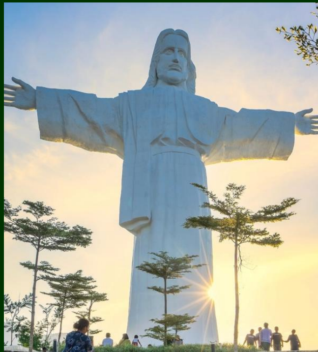
Imagem de Jesus mais alta do mundo é inaugurada na Indonésia

A imagem de Nosso Senhor Jesus Cristo mais alta do mundo foi inaugurada oficialmente na Colina Sibeabea (Sibeábia), no norte de Sumatra. A imagem possui 61 metros de altura, superando o famoso Cristo Redentor, do Rio de Janeiro, em mais de 20 metros e se tornando um marco global.