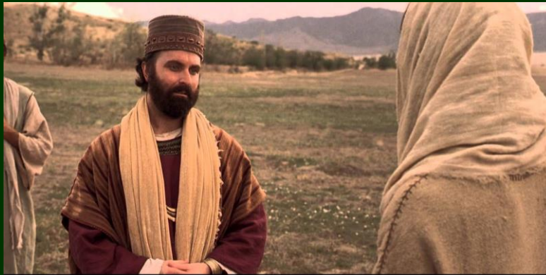
Jesus e o jovem rico

O evangelho deste domingo nos lembra as escolhas que fazemos em nossa vida. O mundo oferece muitas atrações e promessas de felicidade. Não conseguimos conquistar todas. Entre elas, há aquelas que nos enganam. Qual é a escolha fundamental na nossa vida?