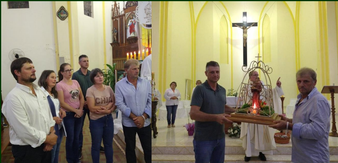
Representantes da comunidade Santa Teresinha de Barão Hirsch

Com Santo Antônio, o padroeiro, unidos na oração e na amizade, somos irmãos e irmãs vivendo sempre a fraternidade