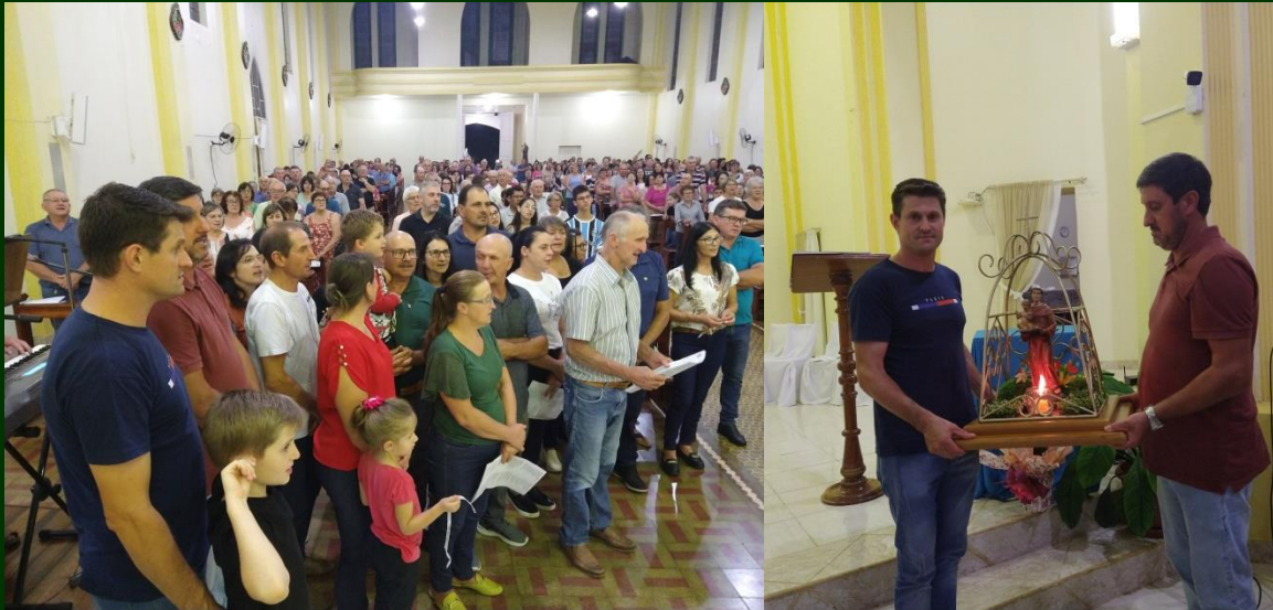
Representantes das comunidade Nossa Senhora Consoladora e Santa Bárbara

No final da missa, depois da bênção dos pãezinhos de Santo Antônio, os representantes das comunidades Nossa Senhora Consoladora e Santa Bárbara entregaram a imagem peregrina de Santo Antônio aos representantes da comunidade Santa Teresinha de Barão Hirsch, que vão animar a liturgia da próxima terça-feira, dia 07 de maio.